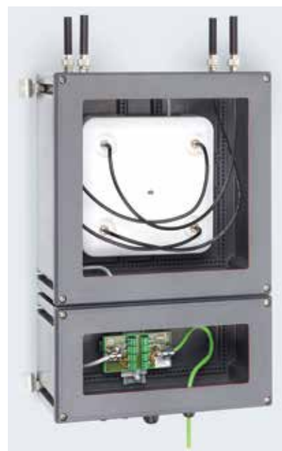
R. Stahl propone dei Wi-Fi Access Point per installazione in Atex zona 1 / 21 (tipo 8265, Ex d) e per zona 2 / 22 (tipo 7145, Ex e)